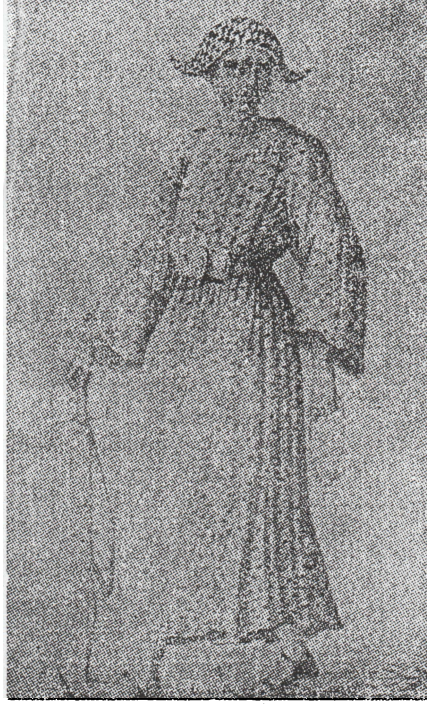
ملك فازغلي سنة ١٨٢١